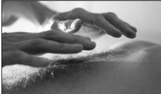
Feinfühliges Handeln hilft dem Körper dabei, sich selbst zu heilen

Wichtig ist hierbei auch die Traktion des Duraschlauches und die Dekompression der Cranialen Basis. Durch die sanfte Arbeit am Duraschlauches und die Dekompression der Wirbelsäule besonders an C0/C1 und L5/S1 sind auch Erfolge bei der Behandlung von Skoliose sowie bei Osteochondrosis und Spondylolysthesis zu verzeichnen.