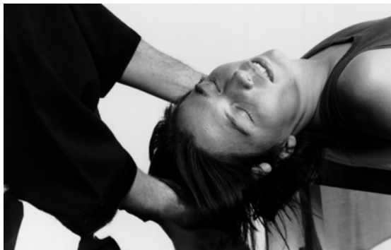
In der Somato-Emotionalen Prozessarbeit® kann der Körper von Innen loslassen

Craniosacral Integration® entwickelte sich aus der Cranial Osteopathy und Craniosacral Therapy®, indem es die Dimension von Bewusstheit, Wachheit und Innerer Achtsamkeit mit einbezieht. Craniosacral Integration® begnügt sich nicht damit, psychosomatische Probleme zu lösen, sondern schafft Raum für neues Lernen und Veränderung von Bewusstsein durch das Fokussieren auf aktive Teilnahme und Selbstverantwortung des Klienten im Selbstregulations- und Heilungsprozess.